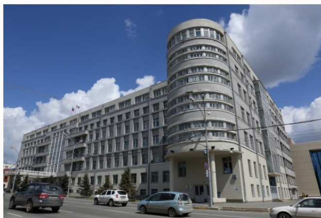
Правительство Новосибирской области Novo-sibirsk.ru

НОВОСИБИРСК, 7 июня 2022, 14:26 — REGNUM В Новосибирской области погибшие ели у здания правительства региона заменят на липы. Об этом сообщил официальный телеграм-канал «Новосибирь».